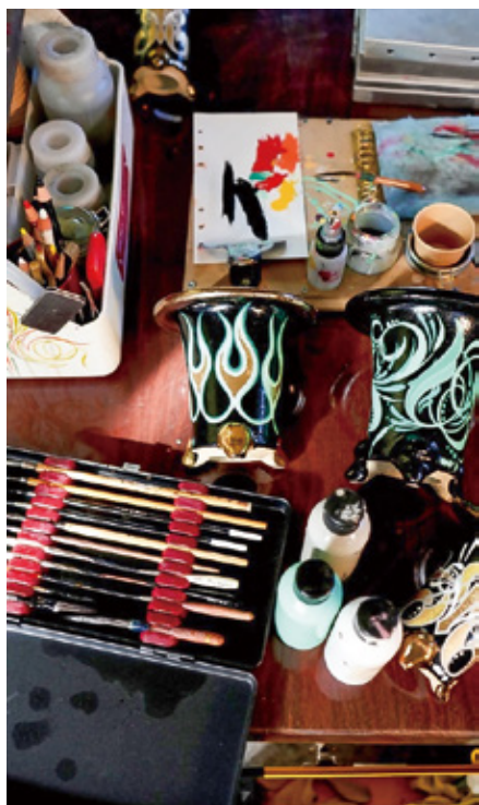
ハーレダビットソンのイベントに出店した万年青鉢

最初の展示会では思うような結果にはつながらなかったものの、その独創的な取り組みは少しずつ注目を集めます。動画配信などを通じて話題となり、県内外から訪れる人が増加。テレビ番組で特集されるなど、万年青の新しい魅力を発信する存在となりました。