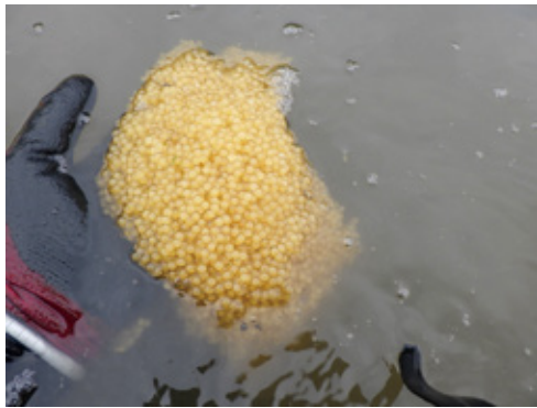
写真 2023年6月下旬に採取されたアメリカナマズの卵塊

今後、石積みみ域での継続調査で本種が産卵しやすい場所の特徴を把握し、産卵適地を減らすなど繁殖抑制を行いながら、水郷の食文化に関わる在来種の暮らしやすい場所を増やしていく方策の検討が望まれます。水郷の大きな石とナマズをめぐる物語は、いまでも形を変えて続いています。