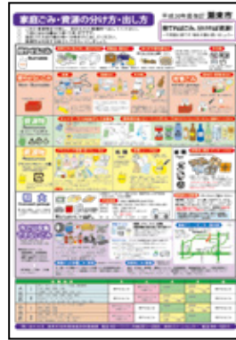
家庭ごみ分別ポスター