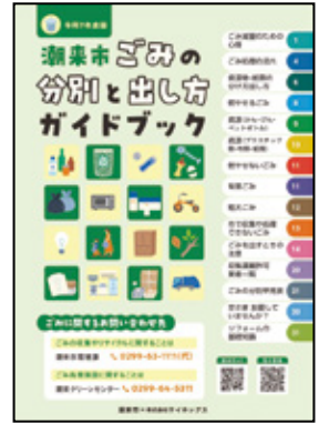
ごみの分別と出し方 ガイドブック (冊子)