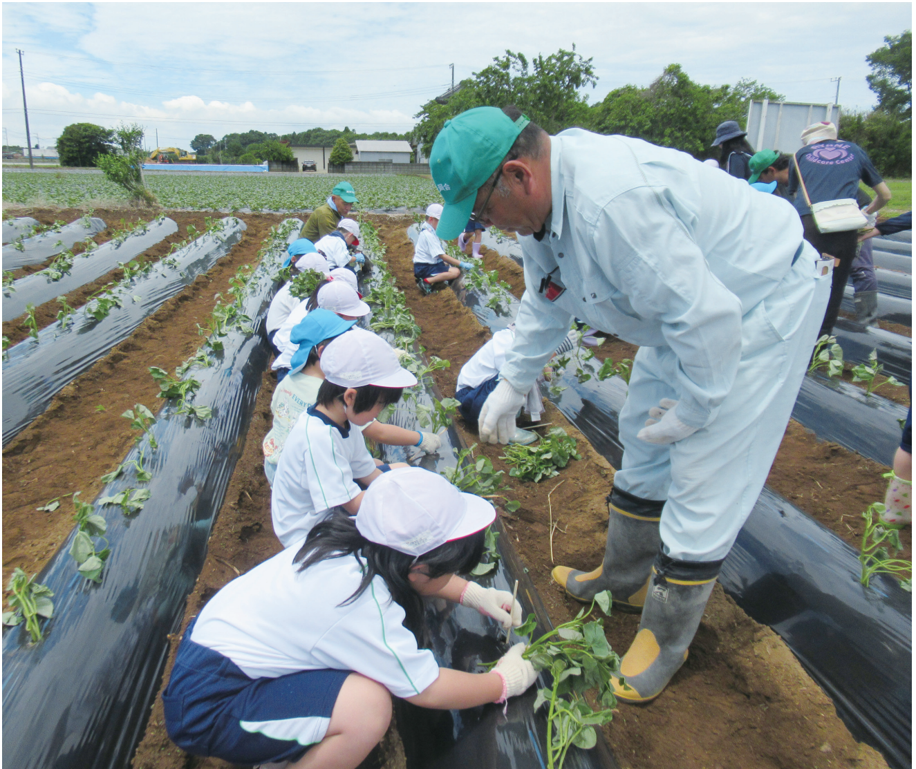
令和7年6月4日 イモ苗植え体験学習 一耕作放棄地解消事業一

発行者 潮来市農業委員会 編集者 広報委員会 TEL 63-1111 内線 270・272