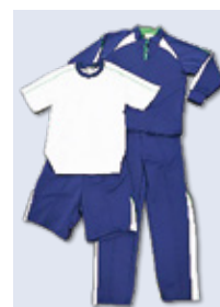
潮来小学校体操服

潮来小学校では体操服のデザインを新たにしており、統合に伴い、令和7年度時点で、潮来小学校及び津知小学校に在籍している1年生から5年生に体操服一式を市より支給します。また、これまでの体操服についても着用可能です。