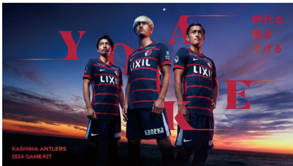
明治安田J1百年構想リーグ新ユニフォームデザインです

(※)一部の大会は対象外となります。詳細は、鹿島アントラーズの公式サイトでお知らせします。