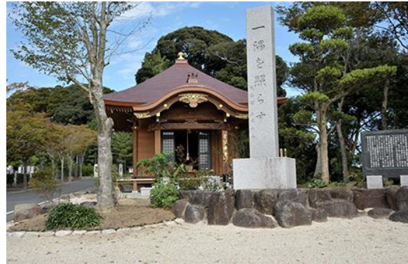
書写仏堂と「一隅を照らす」石碑