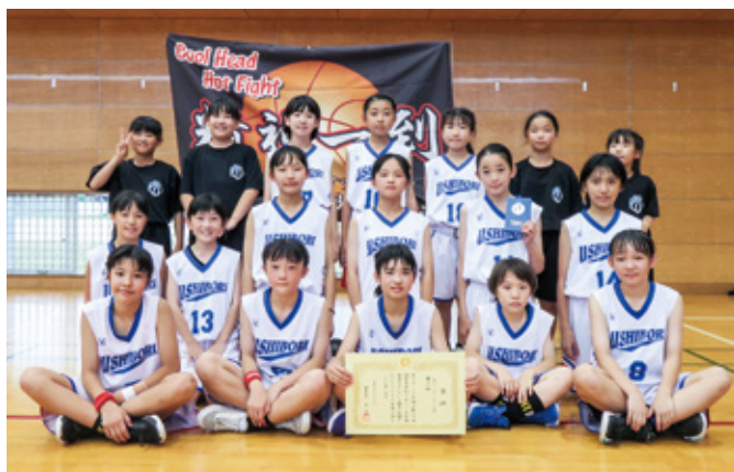
ミニバスケットボールの部(女子) 第3位 牛堀ミニバスケットボールスポーツ少年団