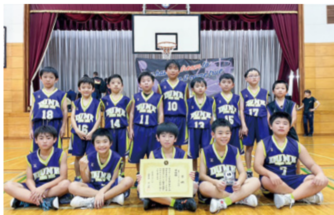
ミニバスケットボールの部(男子) 準優勝 潮来MBCダンクスports少年団