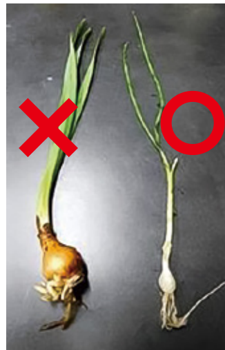
左:スイセン 右:ノビル