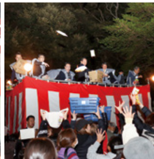
素鷲熊野神社 節分祭