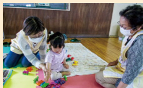
集団預かりの様子