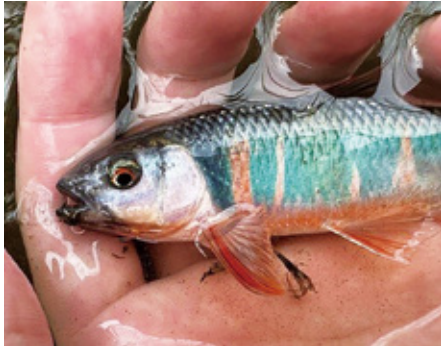
(写真2) 婚姻色がきれいなオイカワ

植物プランクトン、外来植物オオバナムズキンバイ、ユスリカ類幼虫の変遷と貧酸素水塊の関係、ワカサギ資源の動向、消波施設がヨシ帯の魚類群集にもたらす影響など、フィールド調査の結果が発表されました。また、周辺地域での事例として、外来魚チャネルキャットフィッシュが利根川河口域にも侵入し外来種を捕食している実態や茨城県での特定外来生物キョウの確認状況、福島県の帰還困難区域での放射性物質の挙動などの報告もあり、議論も盛り上がりました。