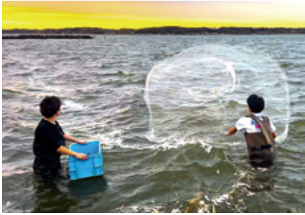
(写真1) 学生たちの魚類調査