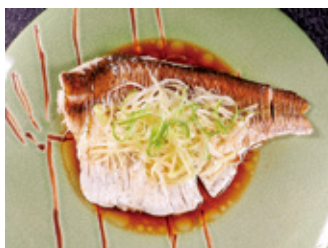
写真3 ダントウボウの蒸し料理

ダントウボウ(写真1)が北浦でよく採れるようになってきました。数年前に霞ヶ浦(西浦)の入り江やその流入河川で増えつつあったのですが、水系ついに広がってきたようです。中国の長江原産のコイ科魚類で、ヘラブナに似ていますが、顔が小さく体がひし形で、背びれ基底が短くて、鱗が細かいのが特徴です。