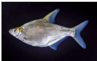
写真1 ダントウボウの稚魚