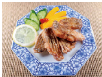
写真2 ダントウボウのから揚げ