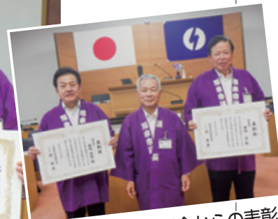
▲全国市議会議長会からの表彰