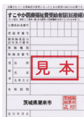
<ラベンダー色の受給者証>