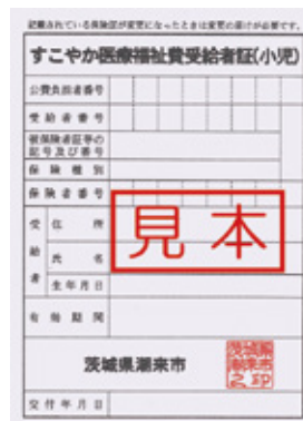
<ラベンダー色の受給者証>