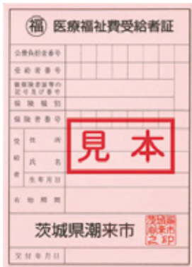
<ピンク色の受給者証>