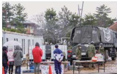
東日本大震災の際、給水支援にあたる自衛隊