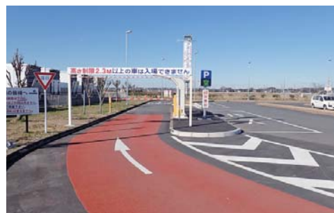
入口を拡張し、発券機・精算機を移設しました