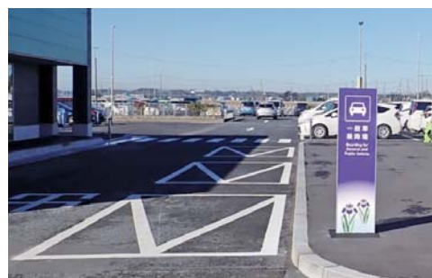
一般車乗降場 送迎の際にご利用ください