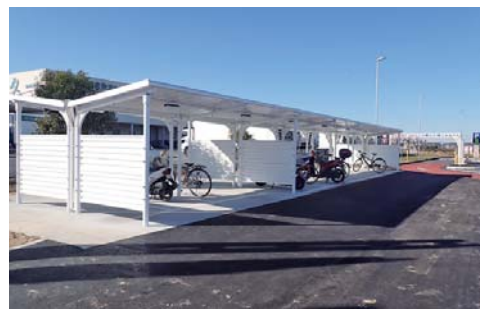
駐輪場を入口左側に移設し、より広くなりました