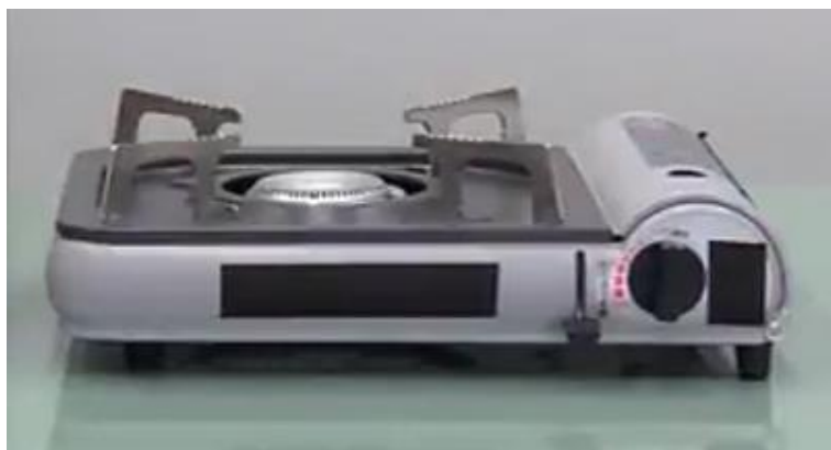
図3 カセットこんろのイメージ

しかし、カセットこんろの誤使用は、ボンベの破裂による火災など重大な事故につながる可能性もあります。以下の注意点に従って、安全にご利用ください。