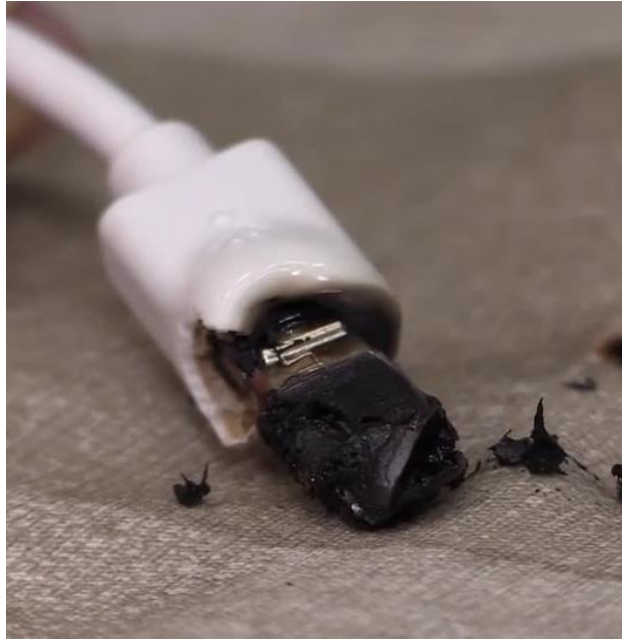
図5 焼損した充電ケーブルのコンネクタのイメージ