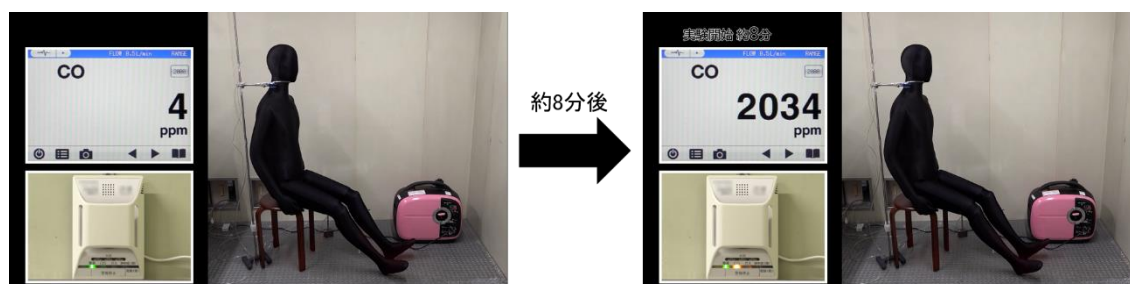
図2 室内で携帯発電機を使用した際の一酸化炭素中毒

当該製品に異常は認められず、換気が十分に行えない屋内で使用したため、排気ガスにより屋内の一酸化炭素濃度が上昇し、一酸化炭素中毒になったものと推定される。なお、本体及び取扱説明書には、「排気ガス中毒のおそれあり。」、「屋内など換気の悪い場所で使用しない。」旨、記載されている。