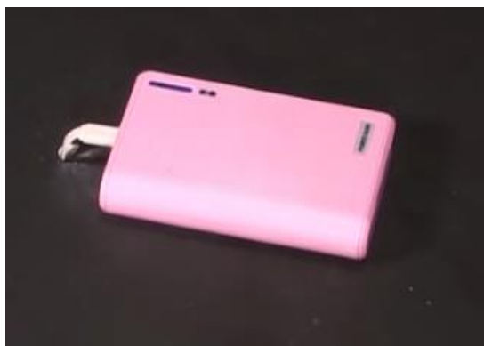
図4 モバイルバッテリーのイメージ

一方で、一定数の事故（火災）が毎年発生していますので、以下の注意点に従って、安全にご利用ください。