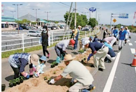
環境保護に関する事業