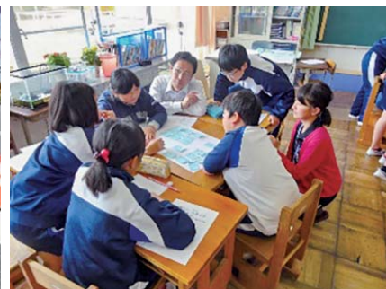
教育に関する事業