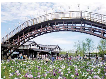
観光に関する事業

潮来市では、集まった寄附金から募集にかかった経費（ポータルサイト掲載委託料等）を差し引いた額を、市の事業に活用しています。活用している事業は左の表のとおりとなります。