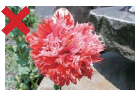
ケシ (ソムニフェルム種)