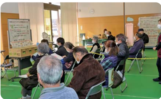
⑤接種後の経過観察