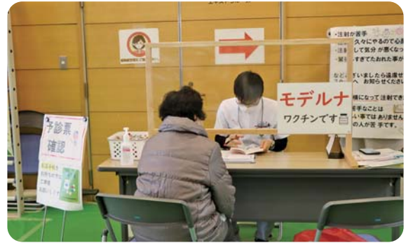
②看護師・薬剤師による予診