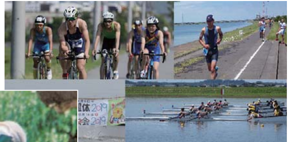
いきいき茨城ゆめ国体2019 (R1)