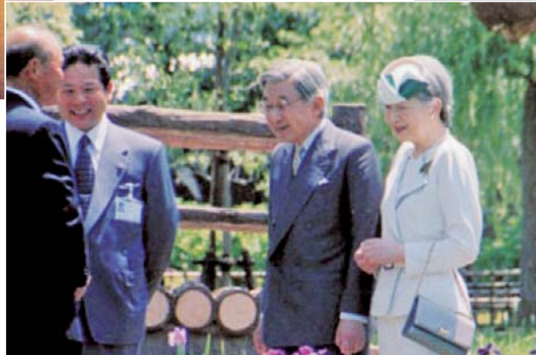
第56回全国植樹祭で前川あやめ園を ご視察される上皇上皇后両陛下 (H17)