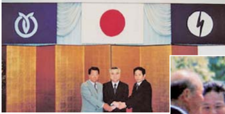
潮来町・牛堀町 合併協定調印式 (H12)