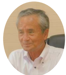
第十一代潮来市議会議長