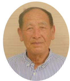
初代潮来市議会議長