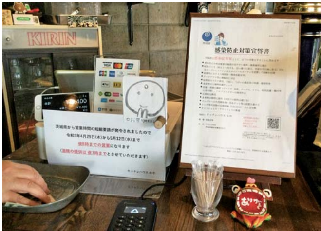
入口に「いばらきアマビエちゃん」宣誓書掲示