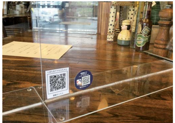
仕切り版に、「いばらきアマビエちゃん」と「COCOA」のQRコード設置