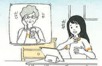
◆家族や友人との会話