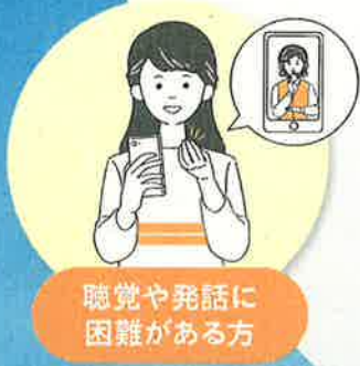
聴覚や発話に 困難がある方