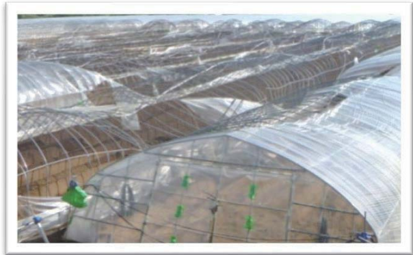
台風第15号で被災したパイプハウス