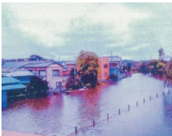
写真-1 平成16年の浸水被害

しかし、近年、毎年のように全国各地で大きな水害や土砂災害が発生しており、いつ災害はやってくるかわかりません。いざというときは、避難（命を守る行動）が必要です。地域の災害リスク、避難場所等の情報を確認しておきましょう。