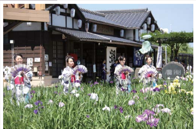
【あやめ園にて踊りの披露】