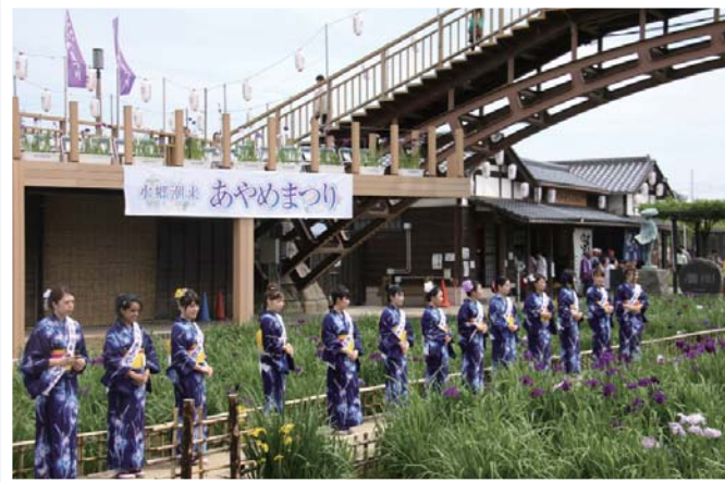
【あやめまつり開会式】