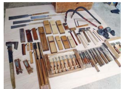
手入れの行き届いた道具

一番大切なポイントは造り手の性格です。「家」は人が終始造るものです。そのため、同じ材料、道具や建築方法で造り上げたとしても、全く同じ「家」ができることはありません。作業する人がそれまで経験してきた人生そのものが顕著に現れてきます。まずは何度も話しをして、任せる大工さんがどんな人なのかを知ってもらいたいです。