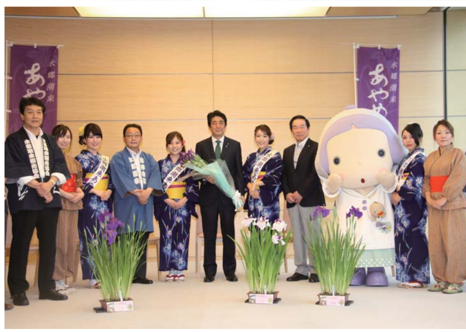
【首相官邸にてPR活動】