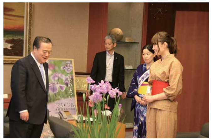
【茨城県庁にてPR活動】