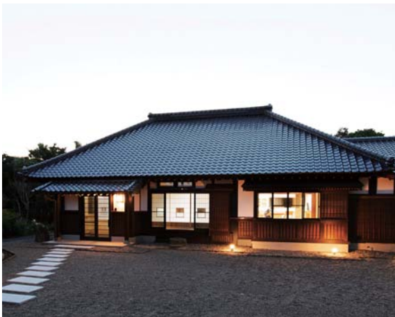
古谷野建築・古谷野建築設計事務所

最優秀賞を受賞したことについては、「小さい頃から見続けていた頑固親父の背中、仕事は習うより盗んで覚えろという職人氣質の親父、そんな父親から受け継いだ先代の仕事が認められたような気がして、率直にうれしかった」と語っていました。しかしながら、「今回の受賞の有無に関わらず、これからも先代の培った仕事を大事にしていき、施主様に喜ばれる住まい造りを目指し一大工として精進していきたい」と今後の目標を話してくれました。