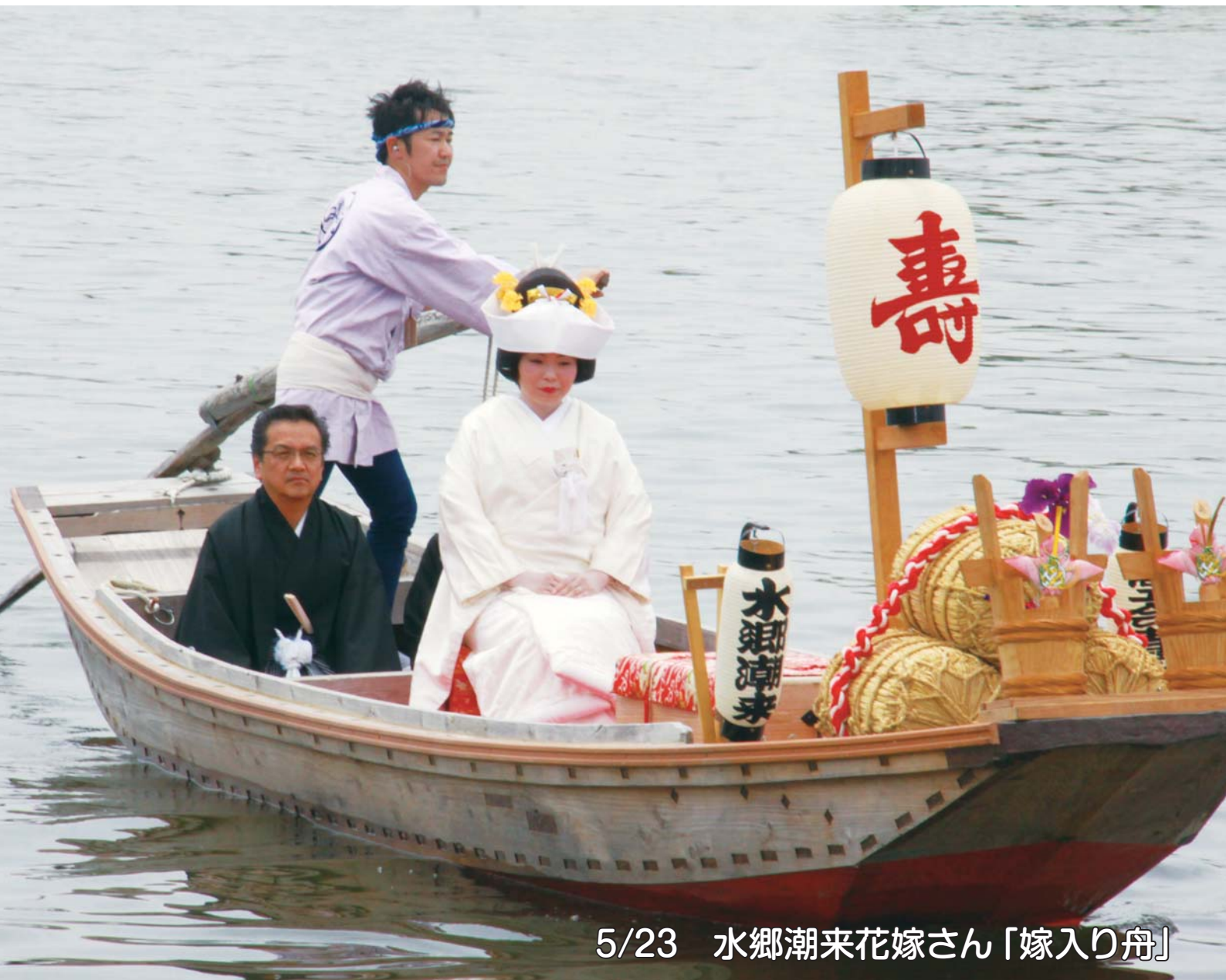
5/23 水郷潮来花嫁さん「嫁入り舟」