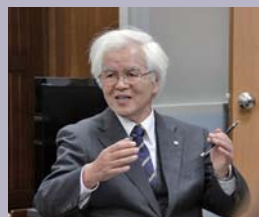
仲澤 富正 (潮来市教育長)