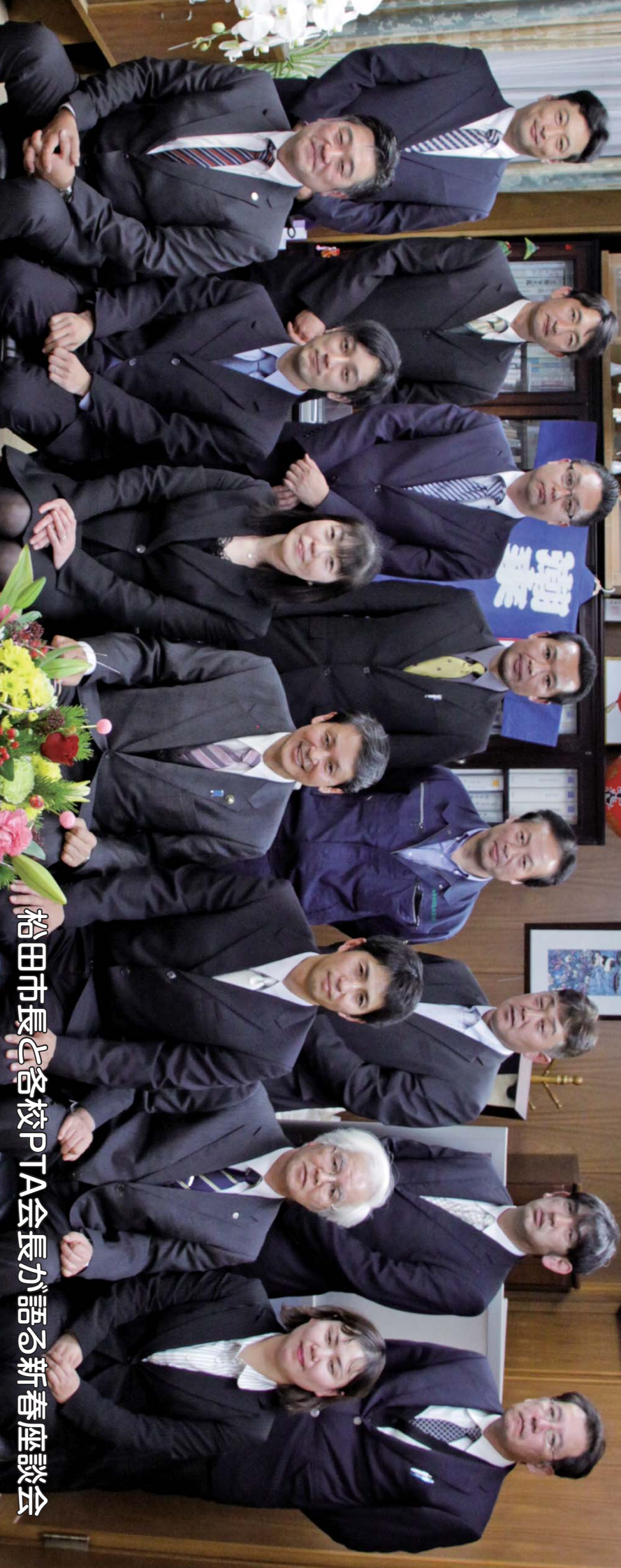
稲田市長と各校PTA会長が語る新春座談会