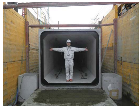
雨水排水路（ボックスカルバート）