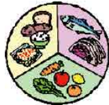
食事のアンバランス・食べ過ぎ