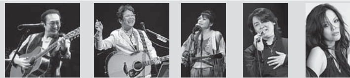
【さだまさし】 【南こうせつ】 【夏川りみ】 【河村隆一】 【相川七瀬】

【日時】 8月11日(木) 午後7時~ 【場所】 県立カシマサッカースタジアム チケット販売店(チケットぴあ各店舗) セブンイレブン、サークルK・サンクス Pコード: 144-345