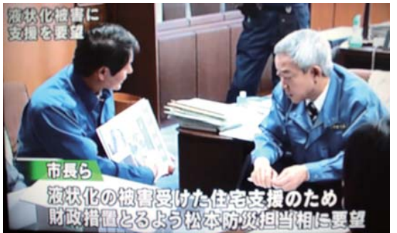
【4/12 テレビ放映された要望の様子】

現在の被災者生活再建支援制度では、「全壊」、「大規模半壊」の対象となる家屋は支援を受けられますが、日の出地区の住宅のように液状化による「半壊」、「一部損壊」家屋では支援の対象外となります。そのため、「被害認定基準に液状化被害の明確化」、「支援金の拡充」、「液状化による被害の新たな支援制度の創設・適用」などの必要性について、手作りによる模型やパネルでの説明により、支援の拡大を強く求めました。