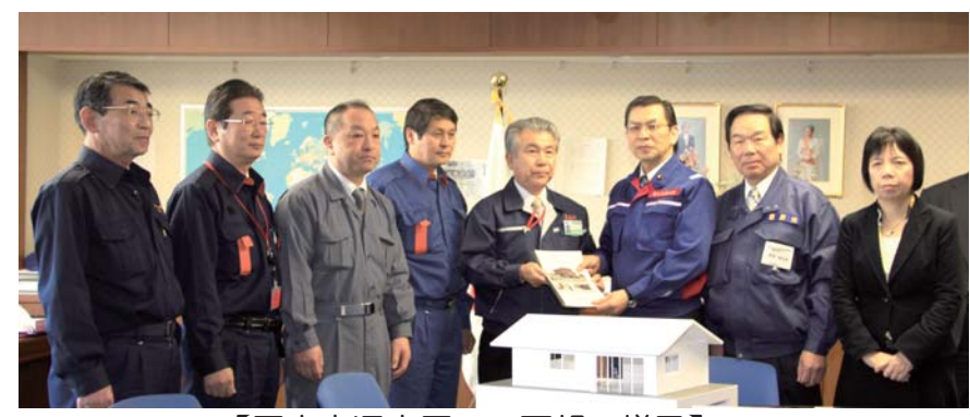
【国土交通大臣への要望の様子】

4月12日(火)、松本市長をはじめとする、鹿嶋市長、神栖市長、稲敷市長、香取市長の利根川下流5市の首長と山口茨城県副知事が額賀衆議院議員の案内のもと、大畠国土交通大臣、松本防災担当大臣、石破自由民主党政調会長に、東日本大震災による大規模液状化被害への支援拡大を求める要望書を手渡しました。