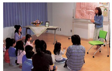
おはなし会の様子