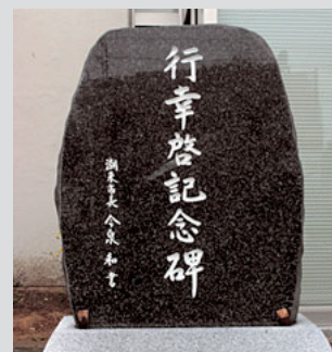
市役所に建立された記念碑

5月28日（日）には、あいにくの雨でしたが、前川あやめ園において、また、5月30日（火）には牛堀小学校において除幕式を行いました。