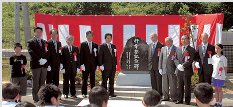
牛堀小学校での除幕式の様子

4月29日（土）、東京都荒川区南千住野球場等を会場として、第20回川の手荒川まつりが、6万人の区民が参加し盛大に開催されました。