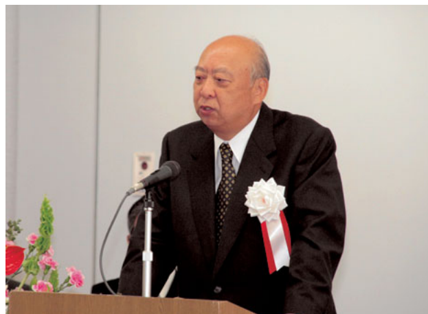
名誉館長に就任された海老沢勝二氏