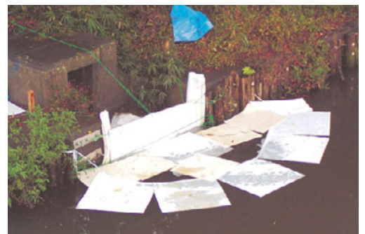
油吸着マットによる、流出防止の様子

【お問合せ】 潮来市環境課 環境対策グループ TEL. 63-1111 内線253