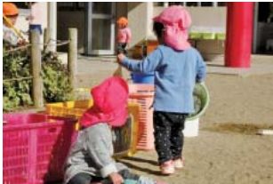
使わない玩具は片づけるんだね。