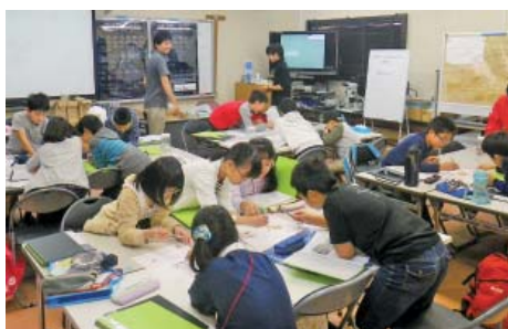
写真2：ごた煮干しの観察に生徒たちが熱中！

です。この伝統食材の実態を把握しようと、霞ヶ浦周辺の12店舗で「ごた煮干し」を購入し、含まれている小魚・小エビ5万尾をひとつひとつ調べてみたところ、10種類も見つかりました（写真1）。お店によっては種類の組成は微妙に異なり、これには漁場や製法の違いが関わっている可能性があります。最近、研究室では、霞ヶ浦の生きものや水産業について小学生が学ぶ教材として、ごた煮干しを活用しはじめています（写真2）。