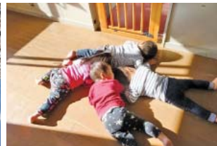
日の当たるところはあったかいな♪