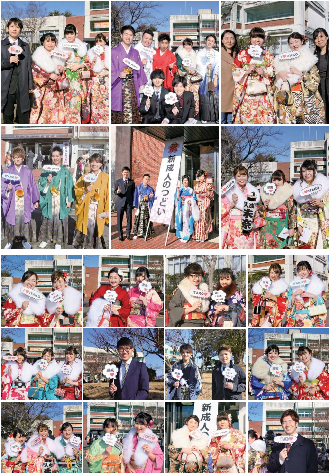
潮来市公式インスタグラム「itakocity」で新成人の写真を掲載しています。