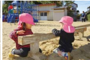
砂を乗せたら楽しいのかな？