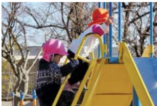
足元に気を付けて。僕も一緒に滑りたい。