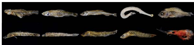
写真1：霞ヶ浦産ごた煮干しに含まれていた小魚・小エビ 写真の上段は左からモツゴ、タモロコ、ワカサギ、シラウオ、ブルーギル 下段は左からハゼ科4種（ウキゴリ、アシシロハゼ、トウヨシノボリ、ヌマチチブ）とテナガエビ

「ごた」は霞ヶ浦の伝統食材です。明治・大正時代の帆引き網漁業の統計では主要漁獲物として計上されましたが、最近の流通量はだいぶ少ないよう