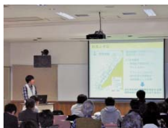
大学生による口頭発表