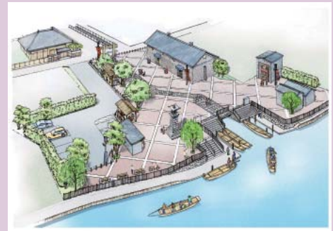
津軽河岸跡周辺整備事業 (イメージ)