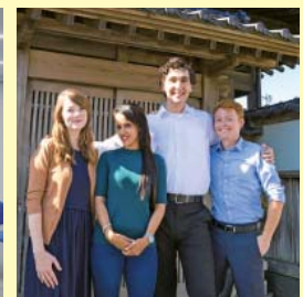
潮来市のALT （英語指導助手）