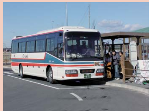
高速バス通勤通学者助成事業

【お問合せ】 秘書政策課 ☎ 63-1111 内線211・212 メールアドレス info@city.itako.lg.jp