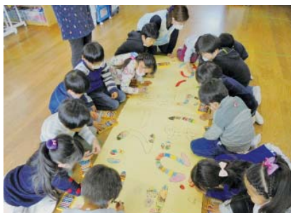
「お別れ会」の看板作り