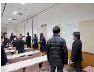
地元高校生も参加したポスター発表