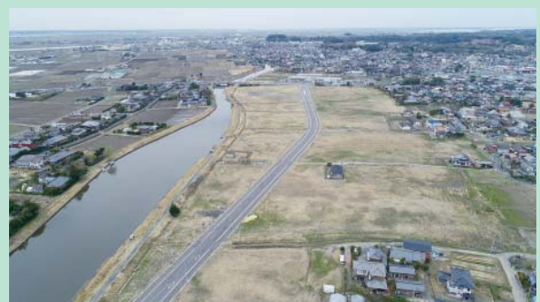
市道（潮）1655線（平成29年度事業）