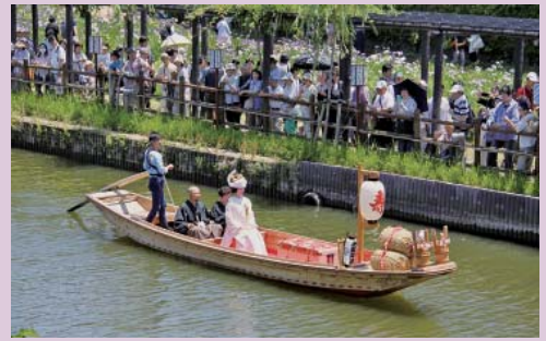
水郷潮来あやめまつり「嫁入り舟」