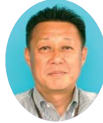
環境経済部長 土屋 健司