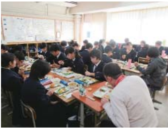
日の出中学校 平成29年12月13日（水）