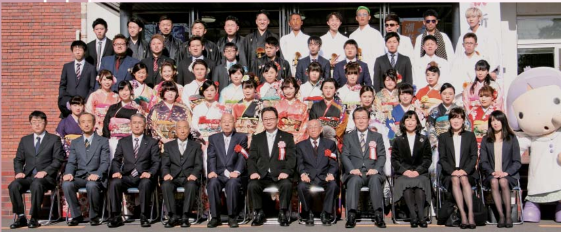
潮来地区 (潮来小学校)