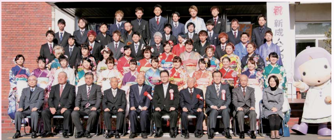
牛堀地区 (牛堀小学校)