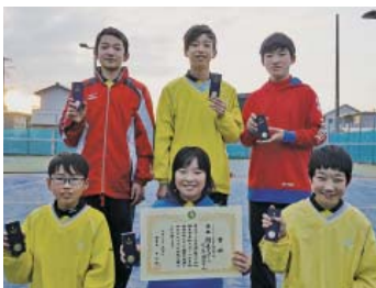
高学年の部 優勝 潮来A