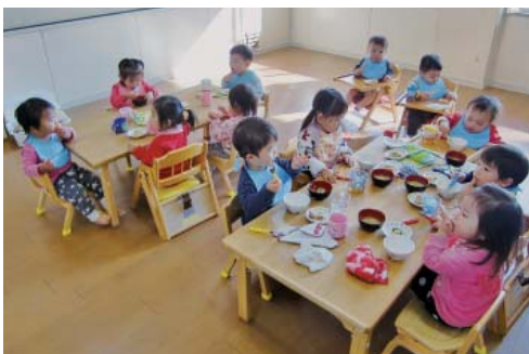
1歳児の食事の様子「おかわりちょうだい♪」