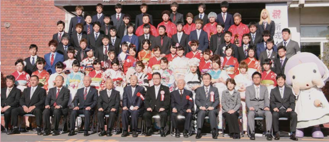
延方・大生原地区 (延方・大生原小学校)