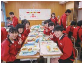
潮来第二中学校 平成29年12月15日（金）