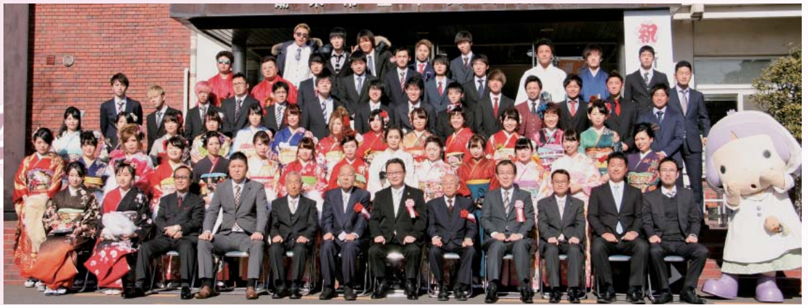
日の出地区 (日の出小学校)