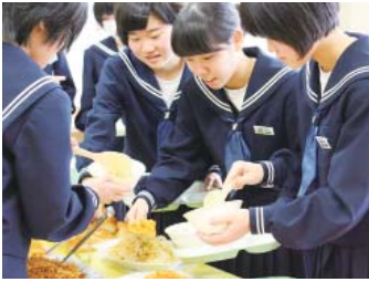
潮来第一中学校 平成29年12月1日（金）

楽しかった、勉強になったなどの感想が寄せられ、生徒達にとってバイキング給食は学校生活の楽しい思い出とともに、卒業後の食生活について考える良い機会となりました。