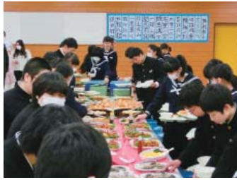
牛堀中学校 平成29年12月8日（金）