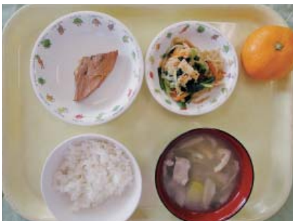
給食メニュー：米飯・かじきの煮魚・切干大根の煮物・さいまいも汁・みかん