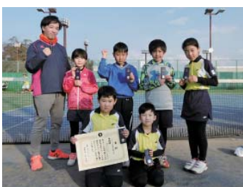
低学年の部 準優勝 潮来A