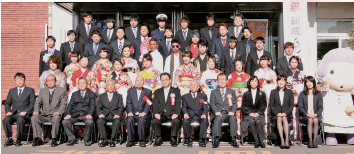
津知地区 (津知小学校)