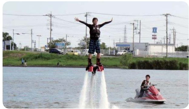
フライボード体験