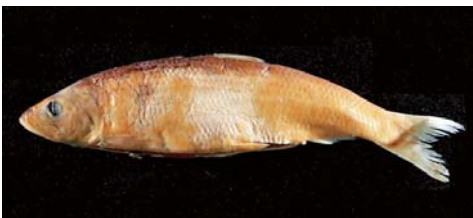
1962年に涸沼で採集されたニシンの標本