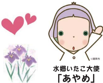
水郷いたこ大使 「あやめ」