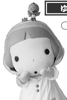
水郷いたこ大使「あやめ」