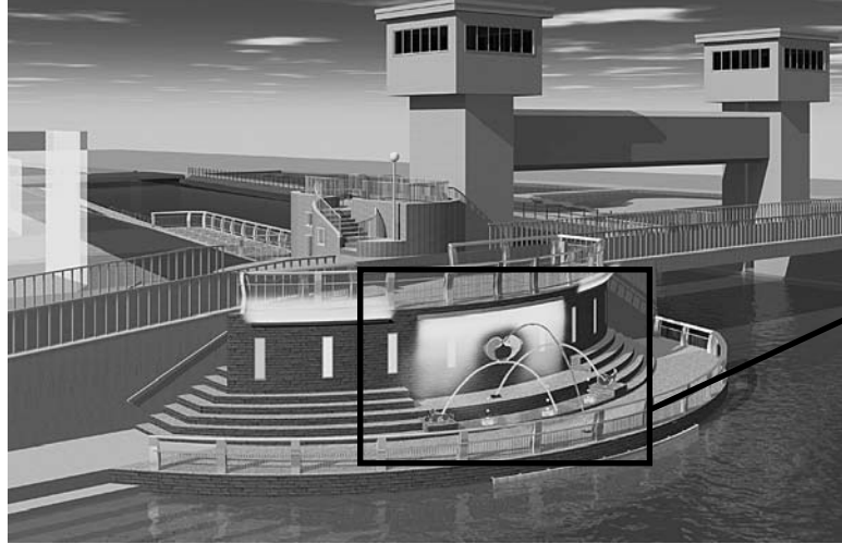
噴水の完成予想図