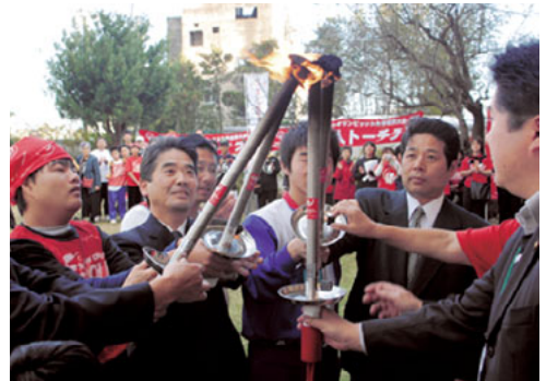
▲集火式（鹿嶋・潮来・神栖の代表ランナー）