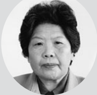
上 丁 きみ