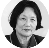
日の出2丁目 志津江