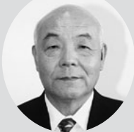
新 町 博