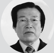
後 明 義継