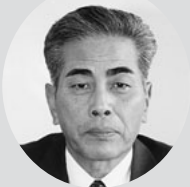
将 監 清