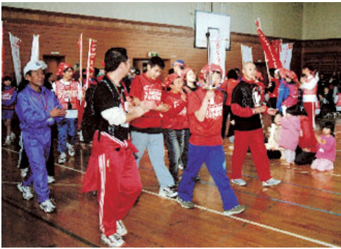
▲日の出小学校体育館で行われたトーチラン

閉幕式の中で行われた集火式では、延べ300名もの参加者が見守る中、潮来市代表のトーチランナーを先頭に、鹿嶋、神栖の代表トーチランナーがそれぞれのトーチ（聖火）を持ち、3つのトーチが1つの大きな炎になると会場全体から拍手が起きました。続いて、司会者の紹介で鹿嶋、神栖、潮来のトーチランナーが壇上に上がると、参加者全員から成功を祝福する拍手と声援がトーチランナーの方々に送られました。