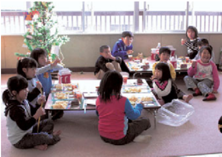
クリスマスツリーを囲みながらクリスマス会

12月24日、潮来児童クラブでクリスマス会が開かれました。この日は小学校の終業式ということもあり、早くから「ただいま」と元氣よく学童クラブにやってきました子どもたちは、学童クラブ指導員が演じる手作りの紙芝居を観賞しました。紙芝居が終わると、子どもたちは自分たちで飾り付けをしたクリスマスツリーを囲んですわり、用意されたケーキや父母会が差し入