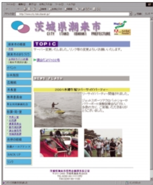
潮来市のホームページ http://www.city.itako.ibaraki.jp/

ホームページに載っている情報はまだまだ少しですが、これから随時情報を追加し最終的には必要な情報がすべて、ホームページ上で閲覧できるようにしていく方針です。