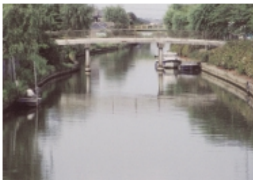
■水辺のサイクリングロード・整備イメージ

ハード、ソフト両面での整備が想定されている前川整備ですが、本年度は河岸復活構想のモデル事業を行う予定です。詳細については現在企画財政課内で検討中ですが決まり次第広報で再度お知らせいたします。