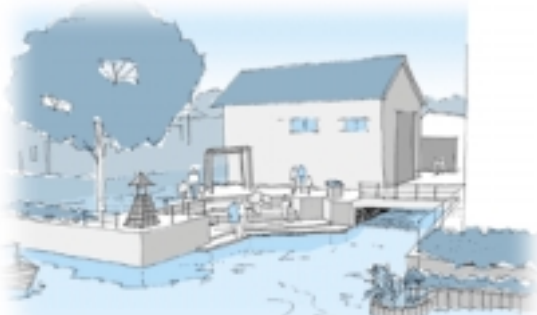
■津軽河岸整備のイメージスケッチ

そのような河岸を復活させ、地域の人々が水に親しみながら楽しめる場所を創造すること、それが前川整備の基本理念である「近き者喜べば、遠き者来る」を達成する第一歩だと考えています。